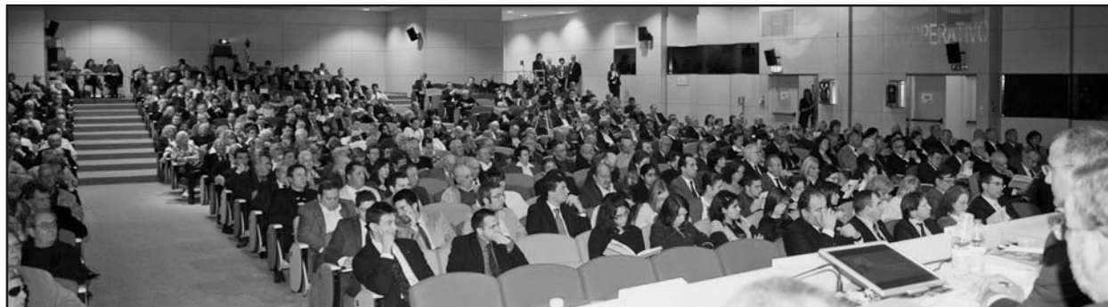
La partecipata assemblea al Centro Fiera.

Anche in questo contesto di mercato decisamente difficile, infatti, la raccolta diretta raggiunge complessivamente il valore di un miliardo e 451 milioni di euro , con un aumento del 10,6% rispetto al 2008; la raccolta indiretta si attesta a 258,6 milioni di euro con una contrazione del 5,9% . Merita tuttavia evidenza il dato della raccolta gestita, che nel corso del 2009 ha invertito la tendenza negativa