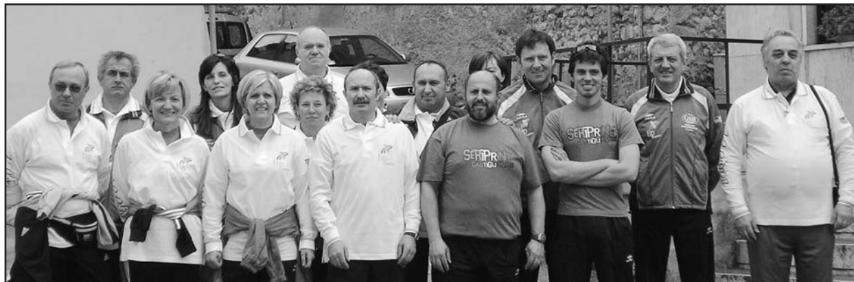
I partecipanti di Borgosotto alla maratona di Roma.

Carichi di entusiasmo siamo partiti alla volta di Roma quasi in 18, non sto a dire il numero esatto perché c'è sem-