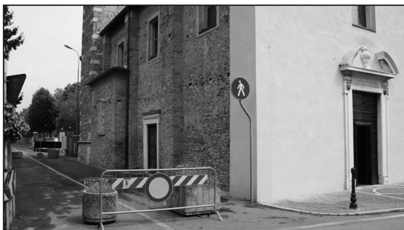
"Il blocco stradale" presso il Santuario dei Novagli.

Provvedimenti discutibili da parte dell'Amministrazione comunale