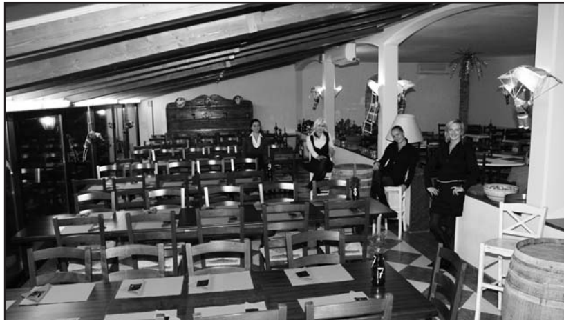
Il suggestivo locale in località Cominello di Lonato.