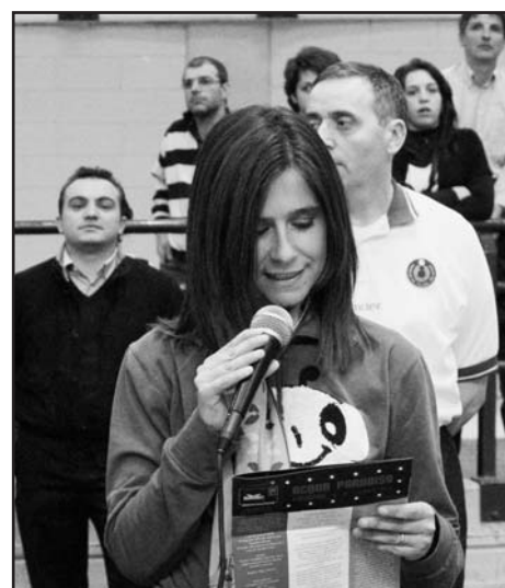
La lettura del comunicato dei tifosi monteclaresi alla presenza di 4500 spettatori nell'ultima partita disputata con la Sisley Treviso al Pala Iper di Monza.

Siamo ancora qui per unirici in un abbraccio a Giulia, il nostro Presidente. Siamo ancora qui per unirici in un unico coro con gli amici tifosi di Monza e sia chiaro, Monza. Perché i nostri colori sono e re-